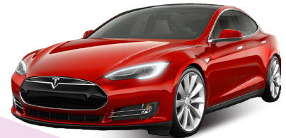
Korttidshyr en av världens intressantaste bilar med 0 g/km i koldioxidutsläpp.